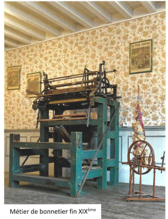
Métier de bonnetier fin XIX ème

- Boeren uit de tijd dat dierenkracht gebruikt werd, - en plattelandsvakwerkers waarvan het opmerkelijke vakwerk halverwege de 20ste eeuw voltooid werd.