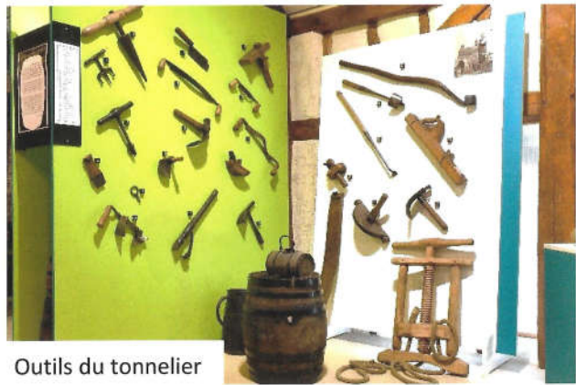
Outils du tonnelier