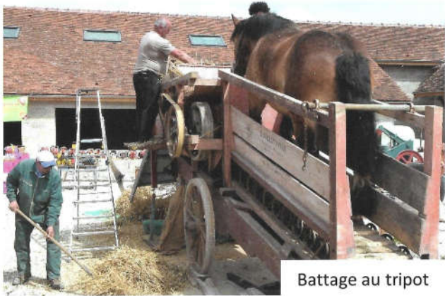
Battage au tripot